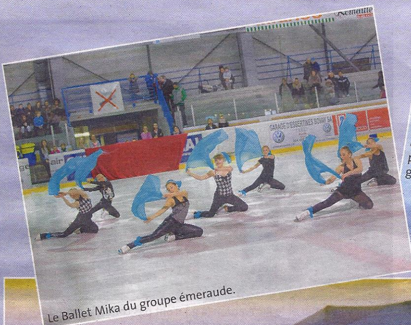
Le Ballet Mika du groupe émeraude.