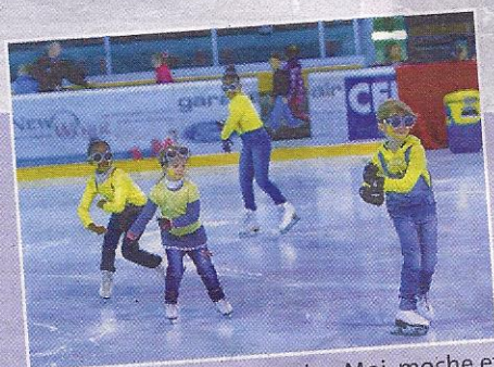
Il y avait des Minions de «Moi, moche et méchant» sur la glace yverdonnoise.