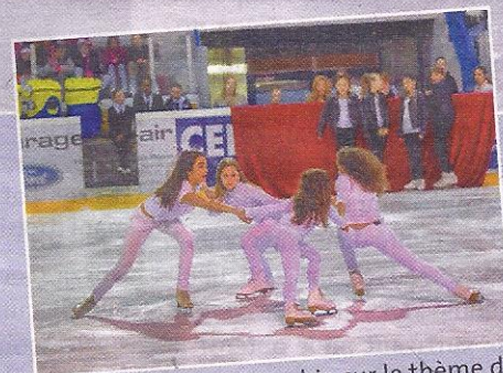
Une chorégraphie sur le thème de James Bond.